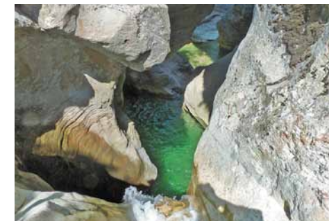
Il Salinello dalla cascata. The Salinello from the waterfall.

Our itinerary ends when the trail turns away from the river towards Castel Manfrino (a more challenging itinerary). To return, we follow the same path back.