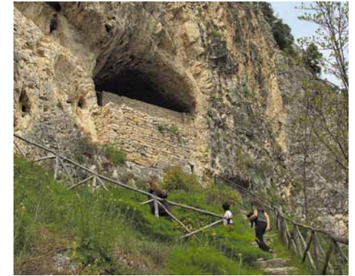
Salita alla Grotta S. Angelo. Climb to the Grotta Sant'Angelo.

Il nostro itinerario termina quando il sentiero si allontana dal fiume proseguendo verso Castel Manfrino (itinerario più impegnativo). Il ritorno si effettua per la stessa via.